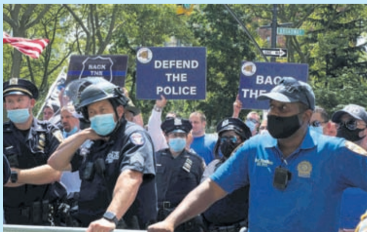
Pro-NYPD demonstrator holds a sign near New York City Hall, Wednesday, July 15, 2020, in New York.